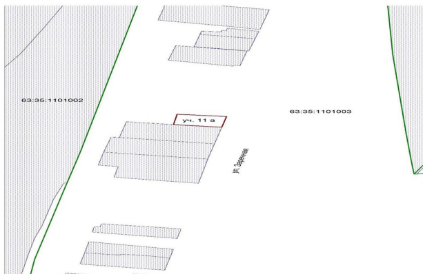
Ситуационный план № 2.

Землепользователь: муниципальный район Чельмо-Вершинский ЗУ1: Самарская обл., Чельмо-Вершинский р-н, пос. Раздолье, ул. Заречная, участок 11а, к/н 63-35-1101003-1856